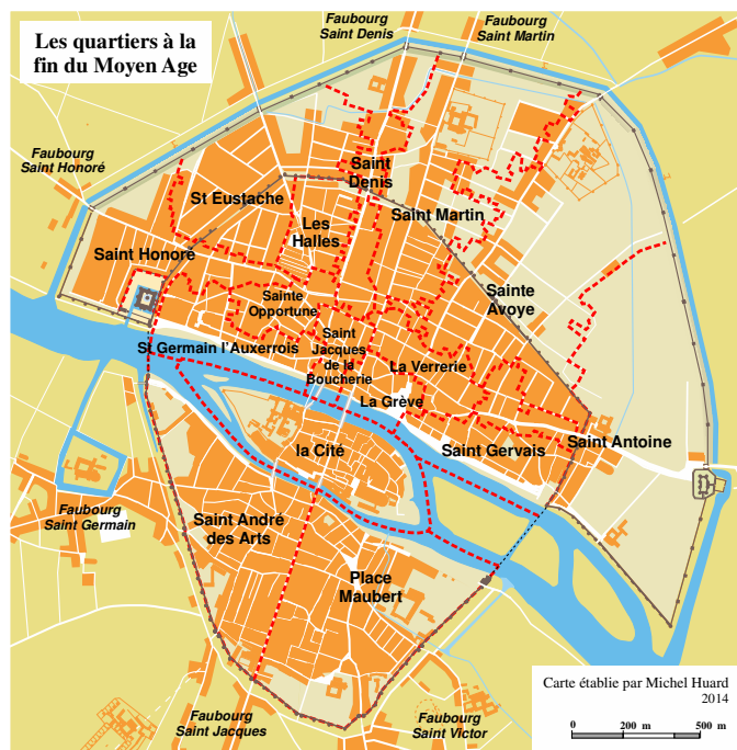
Carte 1 : Enceintes de Philippe Auguste et Charles V.

Dans le cas du regroupement des 4 arrondissements centraux de Paris, il est intéressant de voir que l'unité historique a survécu aux périmètres administratifs. En effet, ils correspondent à la ville intégrée de l'enceinte de Philippe Auguste construite en 1180 et de l'enceinte de Charles V de 1383 comme en témoigne la carte 1.