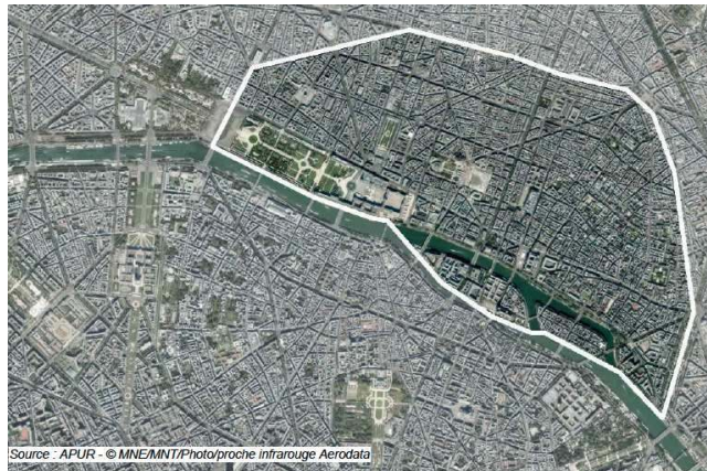
Carte 3 : Fusion des 1, 2, 3, 4e arrondissement de Paris.

Ils sont gardés une cohésion et une homogénéité comme le montre la carte 3, que ce soit dans l'unité de la morphologie urbaine, à l'exemple de la trame viaire, qui malgré les percées haussmanniennes garde des rues de l'époque médiévale. Cette homogénéité des 4 arrondissements se retrouve également dans le mode de vie des habitants au regard de l'analyse statistique que nous ne détaillerons pas dans cette note.