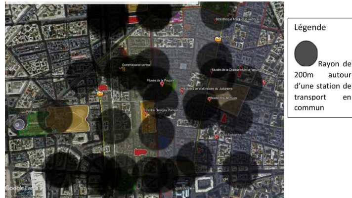
Carte 5 : La ville non desservie en transport en commun.

Source : google earth / Réalisation Julio Ralison, 2017.