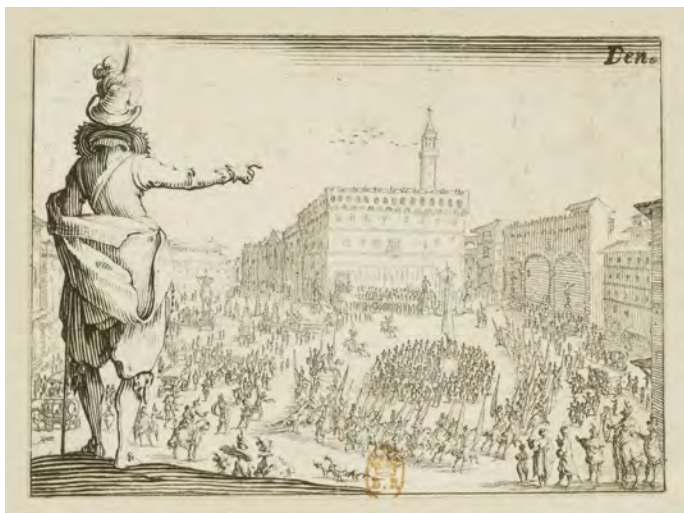
Une fête sur la place de la Signoria à Florence, (série Les caprices), Jacques Callot (1617) [source Gallica.bnf.fr / BnF]

Il s'agit d'un processus consensuel entre vous et vos pairs [les autres responsables hiérarchiques] et le but de la session est de donner à tout le monde un facteur de performance individuelle. Ensuite, vous faites la moyenne du classement collectif qui se situe généralement autour de 1,0. C'est un système en cascade. Les line managers rapportent à leurs supérieurs hiérarchiques jusqu'au niveau du vice-président. Puis on utilise une formule de calcul en janvier, lorsque les résultats de l'entreprise sont annoncés, de telle sorte que vous obtenez le facteur de performance de l'entreprise qui est intégré dans le calcul des primes. Vous pouvez par exemple recevoir un bonus de plus de 20 % de votre salaire annuel.