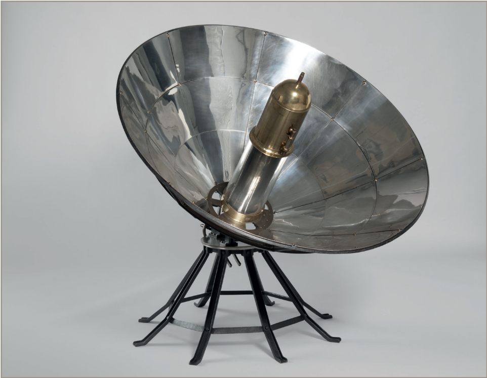
Image 2 - Energie solaire