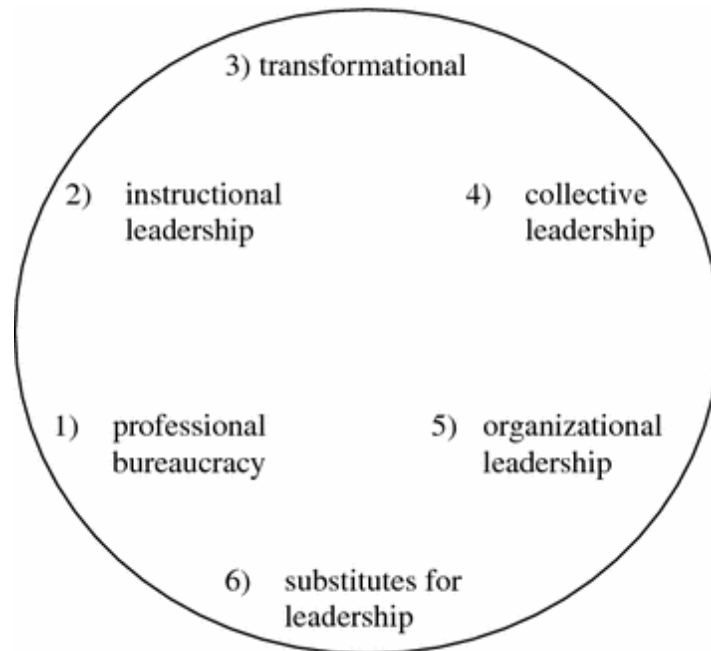
Figure 3. La révolution complète du développement conceptuel du leadership scolaire (Scheerens, 2012)

ajoute deux types : la bureaucratie professionnelle et les substituts au leadership . L'ensemble est représenté dans une grande roue qui, à ses yeux, illustre le parcours des dernières décennies des diverses conceptions du leadership. Il s'agirait d'une « révolution » au sens physique du terme qui incorpore en chemin des éléments des différents types. En ce sens, il ne s'agirait pas d'un retour en arrière.