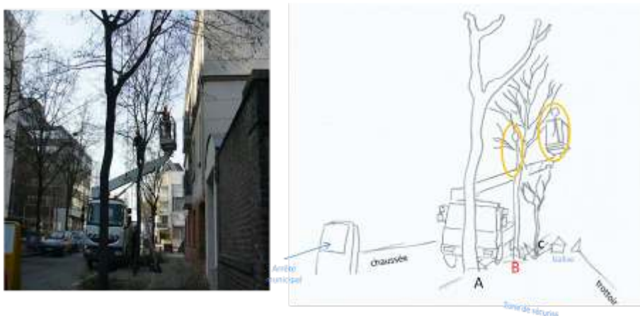
Figure 1. Situation d'élagage 1