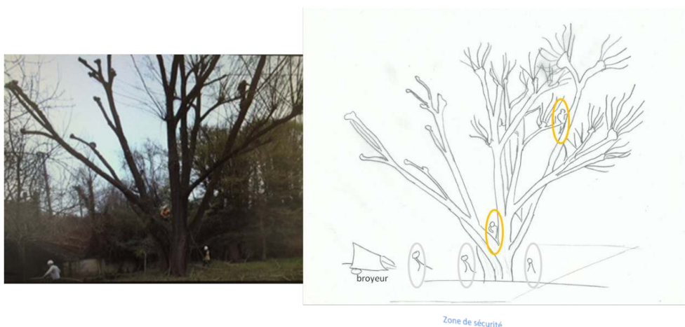
Figure 3. Situation d'élagage 3

53 Deux techniques ont été observées pour l'accès à l'arbre selon l'agent : un grimper cordé au footlock et une grimpe avec les griffes et longe.