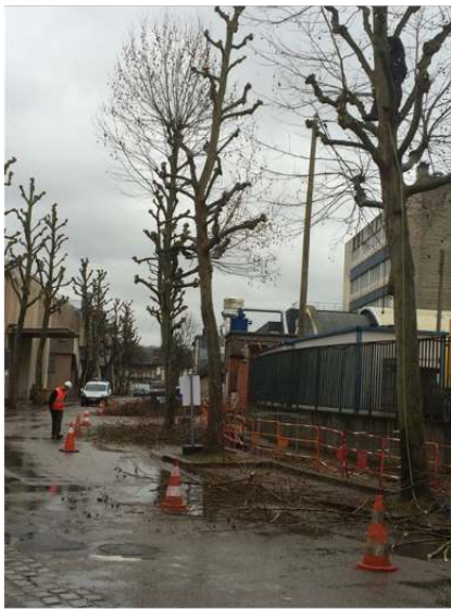
Figure 2. Situation d'élagage 2