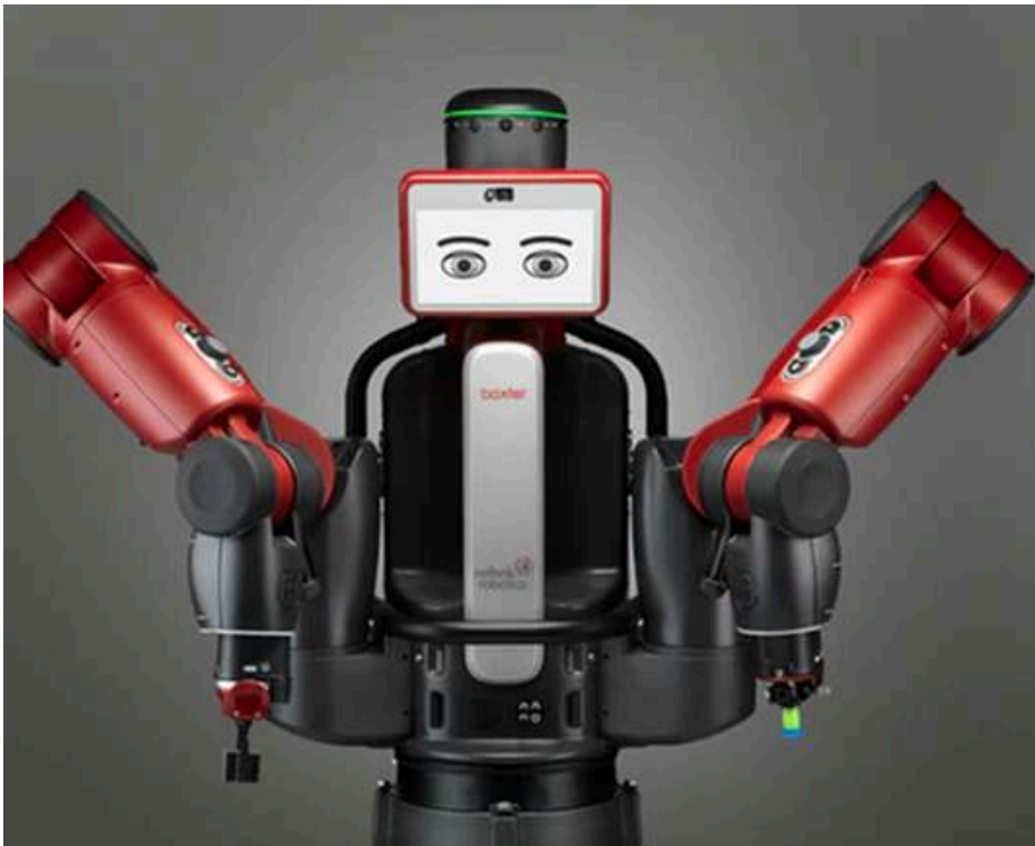
Figure 1 : Baxter. Figure 1: Baxter