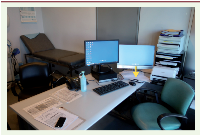
Figure 1. Le box de consultation montrant le dispositif de dictée numérique (flèche jaune).

contacts visuels entre praticiens et patients et l'adressage du geste professionnel en consultation. En dépit de ces ambivalences, nos observations ethnographiques, au cours d'une recherche de terrain au long cours dans un service de chirurgie hépatobiliaire, montrent combien le recours à la dictée vocale constitue une modalité tacite de maîtrise de l'interaction en consultation : dicter son compte-rendu devant le patient aide le praticien à gérer tant la temporalité et l'étendue de l'échange (face aux épanchements et aux débordements des patients), que la conduite du patient, en le responsabilisant en douceur. Ces usages sociaux et symboliques attestent de modalités du contrôle médical renouvelées par l'utilisation des solutions techniques.