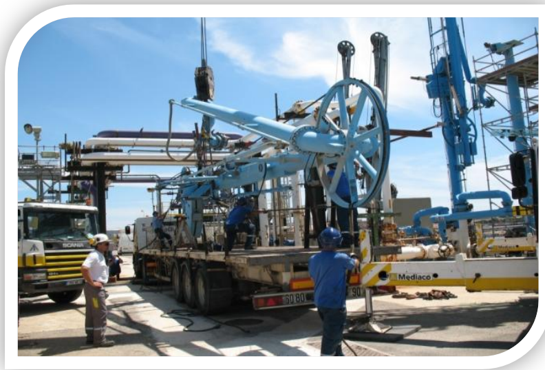
Intervention de maintenance pour le changement d'un bras de chargement

Réfléchir aux problèmes que pose la maintenance préventive et rechercher de solutions, pour en améliorer les conditions de réalisation, intéresse toutes les « parties prenantes », des ouvriers au directeur. Cela concerne aussi bien la bonne marche de l'entreprise et la qualité de l'entretien des installations que la prévention des risques psychosociaux, puisque les difficultés organisationnelles de la maintenance ont des conséquences directes sur les conditions de travail des opérateurs. En 2017, ils avaient évoqué les difficultés matérielles du travail face aux conséquences de la dégradation des installations, lorsque des vannes, des bras et autres matériels sont grippés ou inutilisables par manque d'entretien ; ces difficultés renforçant un sentiment de mépris pour leurs conditions de travail. La prédominance des opérations de maintenance curative sur les opérations de maintenance préventive n'a pas que des incidences sur la vétusté des installations, elle oblige à travailler constamment dans l'urgence et c'est également une source de tensions entre les deux services, électrique et mécanique.