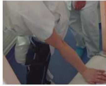
Photo 5 : le patient se relève

Toutefois les apprenants du groupe A ne reproduisent pas à l'identique ce qu'ils avaient prévu : le patient a plus de difficultés à se relever car, lors de l'essai, le repose-pied avait été placé du côté de la jambe valide.