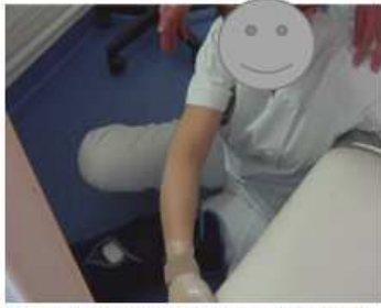
Photo 4 : un repose-pied est avancé