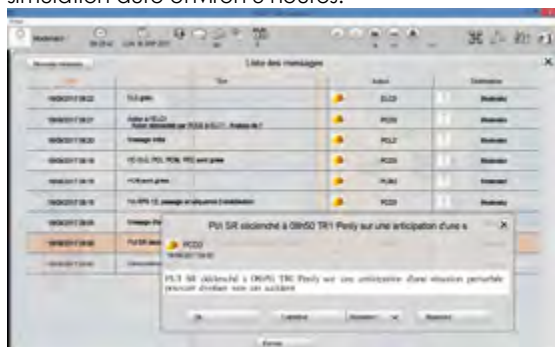
Figure 3 : Interface simulante la remontée d'information vers l'équipe technique

Pour remplir cet objectif, les transpositions effectuées dans la simulation ont visé : 1) à alléger le contexte de simulation en se centrant sur l'équipe ; 2) à simuler les remontées d'informations et les sollicitations des autres parties prenantes pour travailler à la fois sur les dimensions intra-équipe et inter-équipes (Figure 3). La simulation dure environ 3 heures.