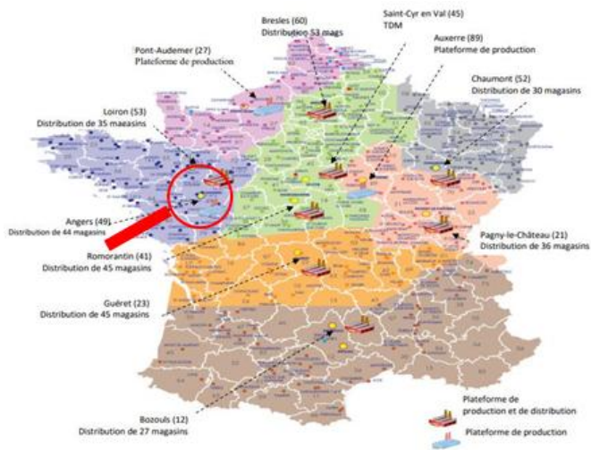
Figure 2. Répartition géographique des 11 plateformes de Noz France