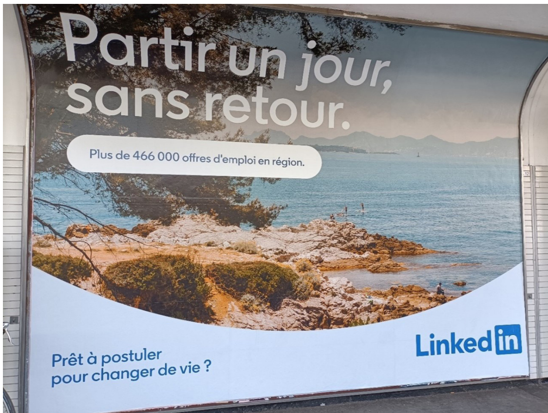
Figure 1. Photographie d'une campagne publicitaire du réseau social professionnel LinkedIn en Île-de-France

essentiellement les « territoires proches des centres urbains [...] mais aussi des territoires qui bénéficient d'aménités spécifiques – l'accessibilité, un climat, une dynamique économique locale favorable » (Popsu Territoires, 2023, p. 8).